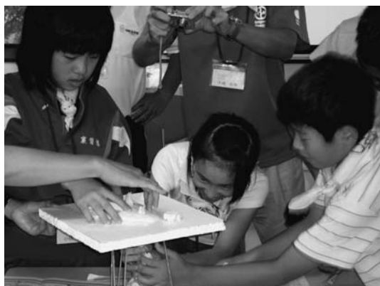
写真 3. 歯科印象材を使った成層火山の実験