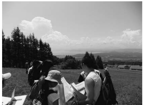
写真 2. 翁島岩なだれの流れ山地形を望む