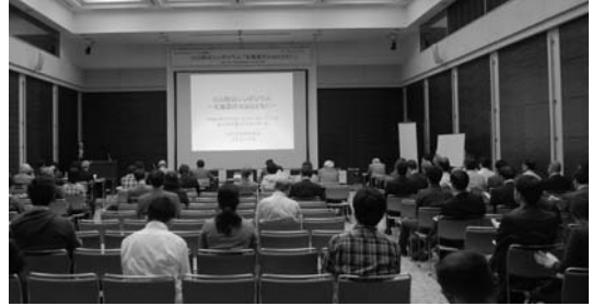
写真 7. 公開火山防災シンポジウム (大雪クリスタルホール大会議室)

ウム「北海道の火山とともに」を大雪クリスタルホール大会議室において実施した(写真7)。事前に市民広報誌やチラシ、ホームページで広報した。参加者は一般市民も含め約90名であった。コンパネーターとして中村洋一(宇都宮大)と藤田英輔(防災科研)とで進められた。プログラム第一部では、旭川市教育長の挨拶の後、田邊敏也氏(壮瞥町教委)による「2000年有珠山噴火からの教訓:北海道の火山との共生」と伊藤和明氏(防災情報機構)による「歴史に見る火山災害」の基調講演が行われた。第二部のパネルディスカッションでは、パネラーとして山中漢(前壮瞥町長)、伊藤和明、宮村淳一(札幌管区気象台)、岡田 弘(北大名誉教授)、村上 亮(北大)、中川光弘(北大)、柴田哲史(旭川開発建設部)、荒牧重雄(山梨県環境科研)の各氏によって、北海道の火山と災害の教訓、十勝岳の火山防災、火山と共生するための防災について問題点や今後の在り方を中心に質疑応答を交えて議論がなされた。