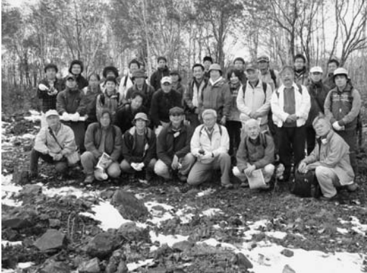
写真 6. 野外討論会, 大雪山・白滝黒曜石巡検 (白滝・赤石山山頂にて集合写真)

6). 1日目は、学術講演会終了後、大会会場前に集合し、貸切バスで東川町の天人峡に向かった。ここでは大雪火山の噴出物を観察することができる。最初の観察ポイントでは、旭岳から流出した溶岩と御鉢平火砕流を遠方から観察した。その後、2箇所の露頭で御鉢平火砕流を間近に観察した。御鉢平火砕流には本質物質として軽石、スコリア、縞状軽石が含まれており、それらが同時に含まれる成因や縞状軽石の形成過程、火砕流の流動機構などについて議論が行われた。その後、宿泊先である層雲峡温泉に移動した。宿泊先では、入浴、夕食後、和田氏、佐野氏から翌日に観察する白滝黒曜石の概要、形成過程などが紹介され、参加者と多くの議論が交わされた。