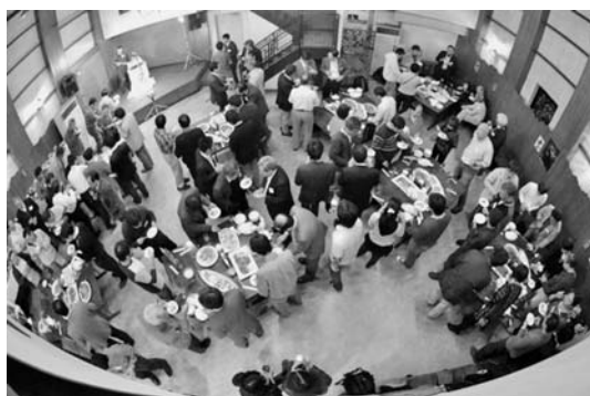
写真4. 学会懇親会(大雪地ビール館)

学会会期中、7社(近計システム、メイジテクノ、白山工業、岩崎、ジオサーフ、ウェザーニューズ、アジア航測)の企業展示会が行われた。展示場所は、学会参加者多数が企業展示に興味を示してもらえるように、A会場