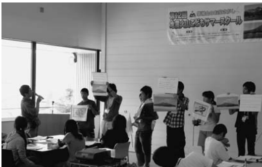
写真 1. 磐梯山の風景の発表

歯科印象材を使った成層火山を作る実験を全員で行いましたが、なかなかユニークな火山ができていきます。火山研究者からは成層火山でも様々なできかたがあり、おもしろいという評価で、カードが子どもたちにどんどん渡されていきます。次に、宇井忠英さん（環境防災