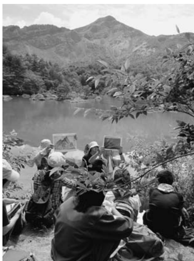
写真 5. 銅沼での解説

その後、「火山の部屋」「地震の部屋」「日本ジオパークの部屋」「磐梯山をジオパークにする部屋」「磐梯山の歴史の部屋」の5つに分かれ、各グループから参加し話を聞きました。終了後、それぞれが聞いてきたことを各部