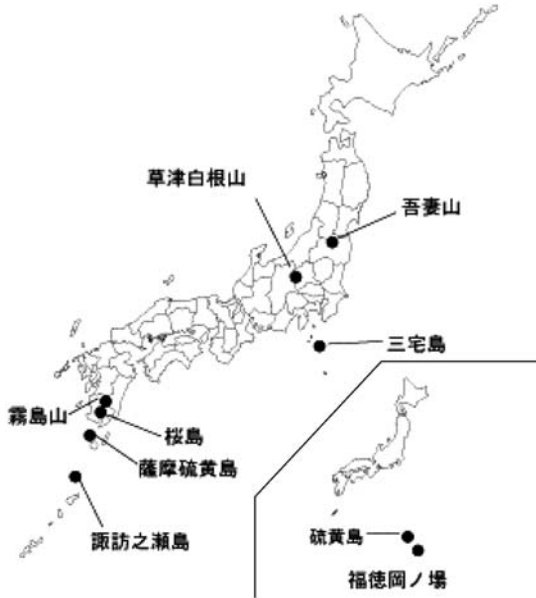
図 1. 2010年5月～6月に目立った活動があった火山