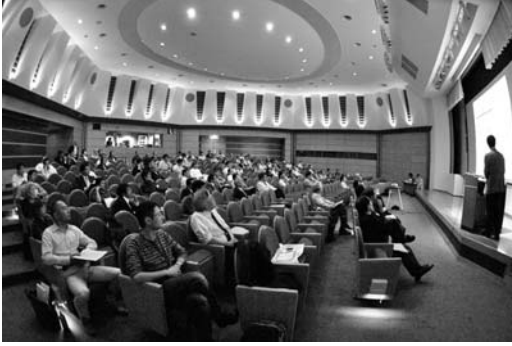
写真 1. 火山防災シンポジウムの様子 (A 会場: 神奈川県立生命の星・地球博物館ミュージアムシアター)

われ、噴火警戒レベルのレベル 4-5 のような大規模噴火での防災対策のあり方について、会場出席者も含めての議論が活発にすすめられた。予定された時間では議論が十分に尽くしきれなかったため、このテーマでの今後のディスカッションの場が期待された。参加者は 200 名余と盛況で、予め用意したシンポジウム講演予稿集が不足した。このため、この講演予稿集の PDF 版を日本火山学会の HP で公開することとした。