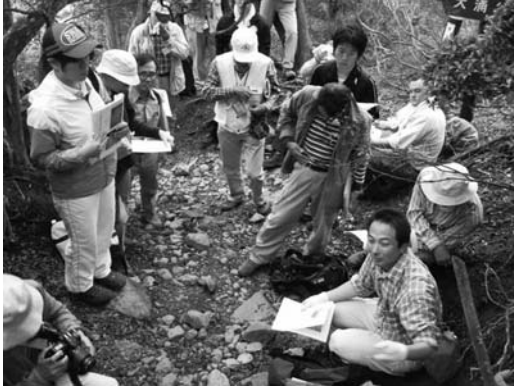
写真 4. 野外討論会 A コースでの議論の様子 (神山登山道)

量の枯死した樹木が山体斜面に広がる様子を観察した。展望台からは、御蔵島、神津島から伊豆大島までの各島、富士山まで遠望できるほどの好天であった。中腹では、八丁平カルデラ形成前から近年まで、三宅島のおよそ 2000 年間の噴火史を示すテフラ層や溶岩流を、山麓では 1983 年噴火をはじめとする歴史時代の噴火に伴ったテフラや溶岩流・割れ目火口群を観察した。昼食を取った伊豆岬では、斜長石巨晶を含む約 1 万年より前の溶岩や、マール形成に伴う爆発角礫岩・火山豆石層などの古い時代の噴出物、そして最近の代表的なテフラまで、三宅島の玄武岩質火山活動を特徴づける堆積物を観察した。午後には、2000 年噴火以降の泥石流により埋もれた椎取神社や、マグマ水蒸気爆発に伴い形成された大路池や新瀧池を訪れたほか、1983 年噴火時に形成された新鼻の火砕丘断面を観察し、議論した。14 日は、1983 年溶岩流による阿古地区での被害状況を観察するために、旧阿古小・中学校跡などを訪れた。三宅島村役場阿古仮庁舎では、火山ガス観測システム (COMPUSS) に関する説明があり、また島の東側の坪田高濃度地区にある三池庁舎では脱硫装置や火山ガス警報システムについて担当者から説明があった。三池庁舎や空港などのインフラを泥石流から守るために建設された金曾ダムと周辺の植生の様子についても観察した。三宅島の卓越風の風下に当たる坪田地区では火山ガスの影響が強く、植物の枯死に伴う土壌の保水力や強度の低下がとくに著しいために、二次的に泥石流が発生しやすい状況が続いているとのことである。その後一行は阿古で昼食をとり三宅島をあとにした。14 日の午前中に一時雨がばらついたものの、巡検は概ね予定通りに進められた。参加者は、2000 年噴火から 9 年が経った三宅島の現在と、今もなお続く火山ガスや泥石流による災害の実態、また、割れ目噴火やマグマ水蒸