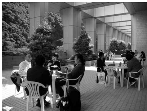
写真 7. 気持ちの良い昼食会場となった屋外テラス