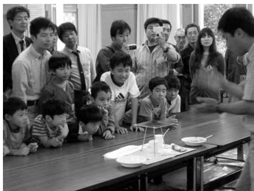
写真 6. ココア実験を見守る参加者