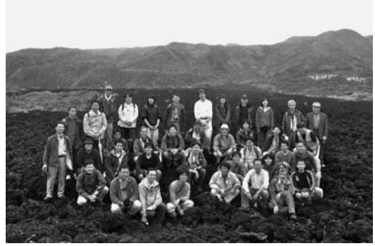
写真 5. 野外討論会 B コースの参加者集合写真 (三宅島阿古の 1983 年溶岩流上にて)

量の枯死した樹木が山体斜面に広がる様子を観察した。展望台からは、御蔵島、神津島から伊豆大島までの各島、富士山まで遠望できるほどの好天であった。中腹では、八丁平カルデラ形成前から近年まで、三宅島のおよそ 2000 年間の噴火史を示すテフラ層や溶岩流を、山麓では 1983 年噴火をはじめとする歴史時代の噴火に伴ったテフラや溶岩流・割れ目火口群を観察した。昼食を取った伊豆岬では、斜長石巨晶を含む約 1 万年より前の溶岩や、マール形成に伴う爆発角礫岩・火山豆石層などの古い時代の噴出物、そして最近の代表的なテフラまで、三宅島の玄武岩質火山活動を特徴づける堆積物を観察した。午後には、2000 年噴火以降の泥石流により埋もれた椎取神社や、マグマ水蒸気爆発に伴い形成された大路池や新瀧池を訪れたほか、1983 年噴火時に形成された新鼻の火砕丘断面を観察し、議論した。14 日は、1983 年溶岩流による阿古地区での被害状況を観察するために、旧阿古小・中学校跡などを訪れた。三宅島村役場阿古仮庁舎では、火山ガス観測システム (COMPUSS) に関する説明があり、また島の東側の坪田高濃度地区にある三池庁舎では脱硫装置や火山ガス警報システムについて担当者から説明があった。三池庁舎や空港などのインフラを泥石流から守るために建設された金曾ダムと周辺の植生の様子についても観察した。三宅島の卓越風の風下に当たる坪田地区では火山ガスの影響が強く、植物の枯死に伴う土壌の保水力や強度の低下がとくに著しいために、二次的に泥石流が発生しやすい状況が続いているとのことである。その後一行は阿古で昼食をとり三宅島をあとにした。14 日の午前中に一時雨がばらついたものの、巡検は概ね予定通りに進められた。参加者は、2000 年噴火から 9 年が経った三宅島の現在と、今もなお続く火山ガスや泥石流による災害の実態、また、割れ目噴火やマグマ水蒸