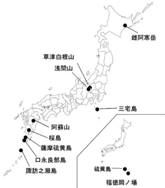
図 1. 2009年3月～4月に目立った活動があった火山